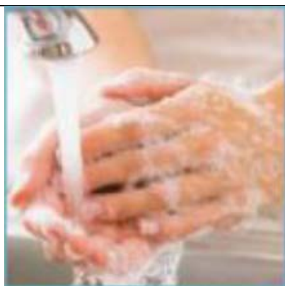
LAVARE ACCURATAMENTE LE MANI

I facciali filtranti FFP2 sono usa e getta, vanno gettati via quando si riscontra un'alta resistenza respiratoria e non lavabili.