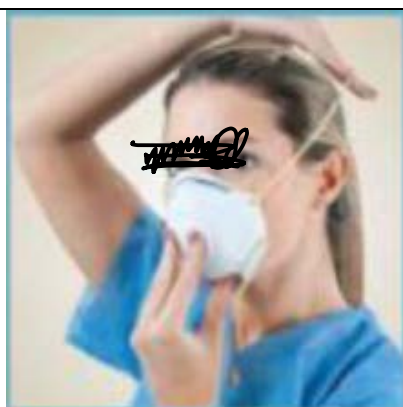
TENENDO LA MASCHERINA SUL VOLTO, TIRARE L'ELASTICO SUPERIORE E FARLO PASSARE DIETRO LA TESTA SOPRA LE ORECCHIE