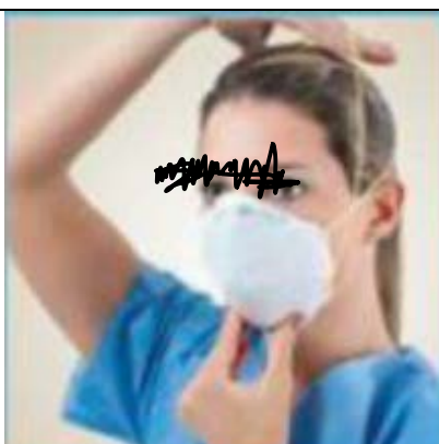
TENENDO LA MASCHERINA SUL VOLTO, TIRARE L'ELASTICO INFERIORE E FARLO PASSARE DIETRO LA TESTA SOTTO LE ORECCHIE