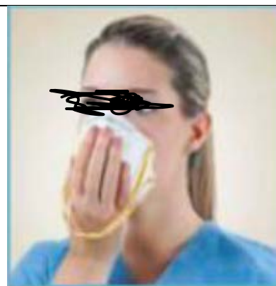
PORTARE LA MASCHERINA SUL VOLTO, LA BASE SUL MENTO E IL NASELLO SOPRA IL NASO, IN MODO DA COPRIRLO