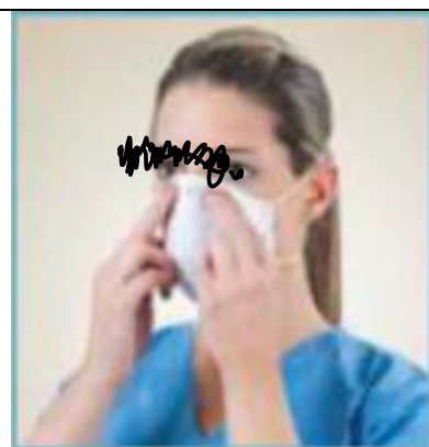
CON ENTRAMBE LE MANI, AGGIUSTARE IL NASELLO AFFINCHE' ADERISCA PERFETTAMENTE AL NASO