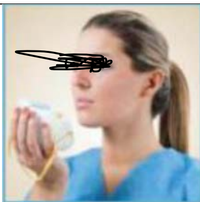
APPOGGIARE SUL PALMO DELLA MANO LA MASCHERINA E FAR PASSARE I LACCETTI SUL DORSO DELLA MANO (TENERE IL NASELLO RIVOLTO VERSO L'ALTO)