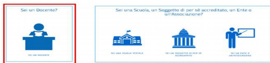
Figura 10- Selezione del profilo Docente

Dopo aver specificato e confermato il proprio indirizzo elettronico istituzionale, l'utente riceverà l'e-mail di Conferma registrazione al portale e potrà accedere alle funzioni di sua competenza (profilo: Docente) presenti sulla piattaforma della formazione.